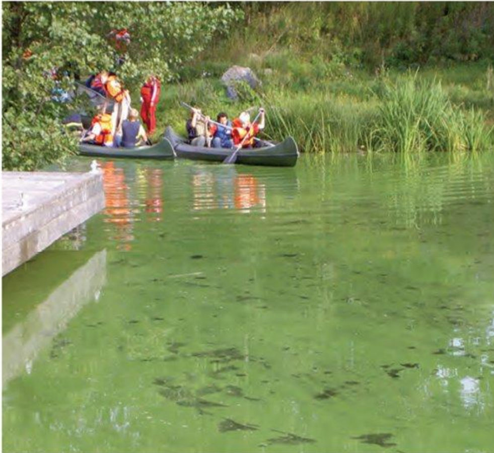
Giftige blågrønne alger farget vestre og nedre Vansjø grønn, og førte til bade- forbud fra 2001-2007.