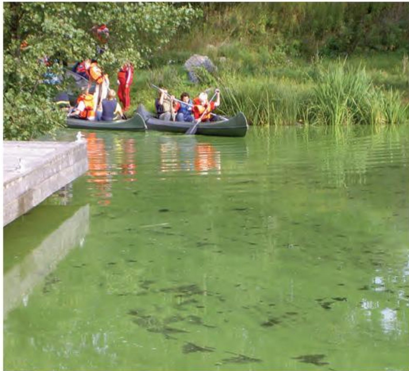
Giftige blågrønne alger farget vestre og nedre Vansjø grønn, og førte til badeforbud fra 2001-2007.