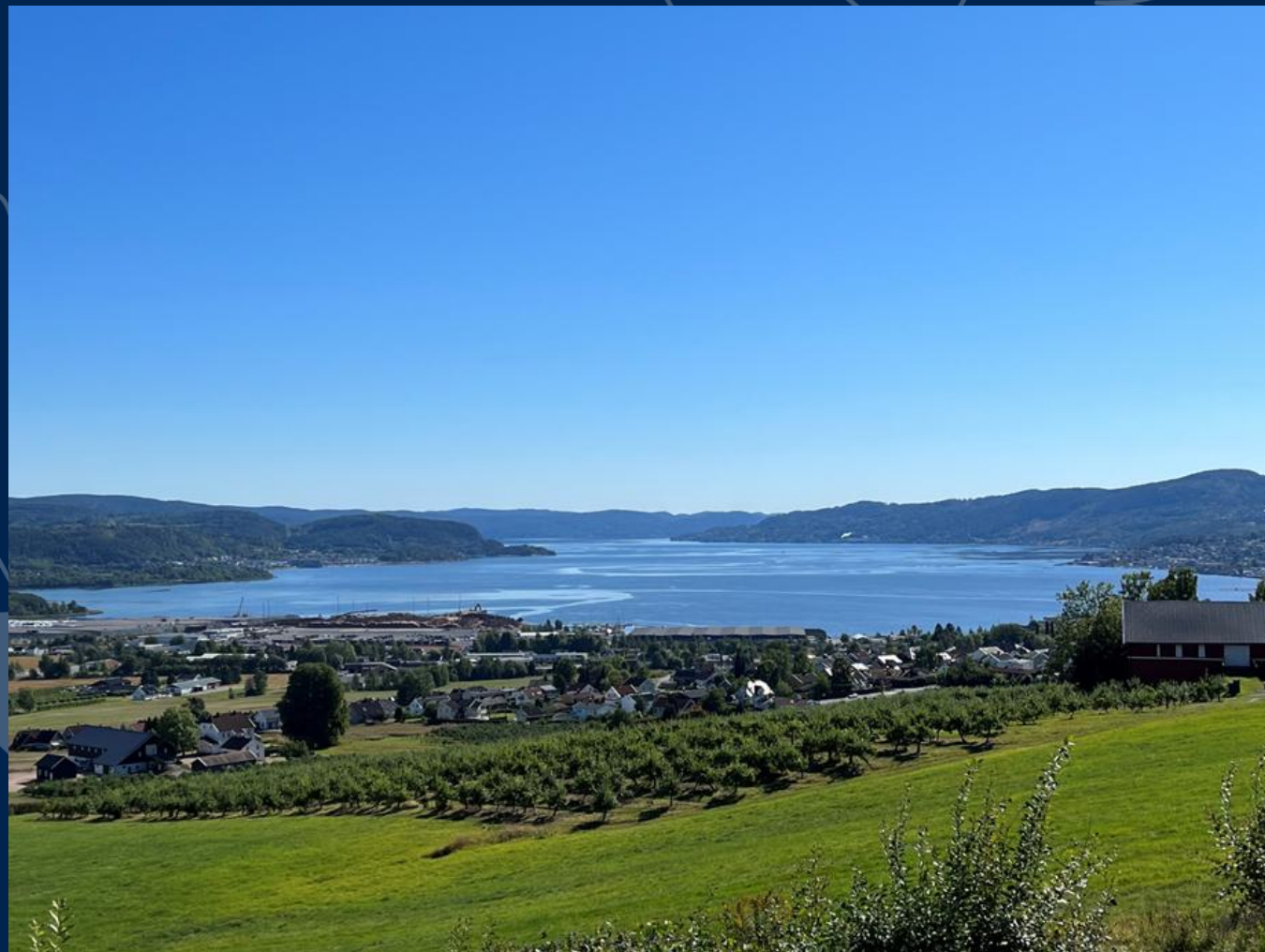
Drammensfjorden fra Lier.