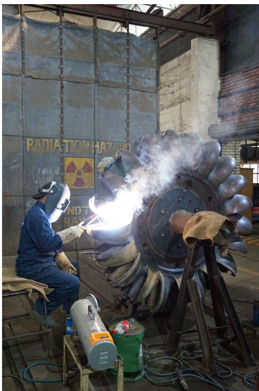
Det sveises på nytt metall for å reparere erosjonsskadene. Mye arbeid med fiksing av eroderte løpehjul. Det gjaldt å ikke stirre for hardt på de.