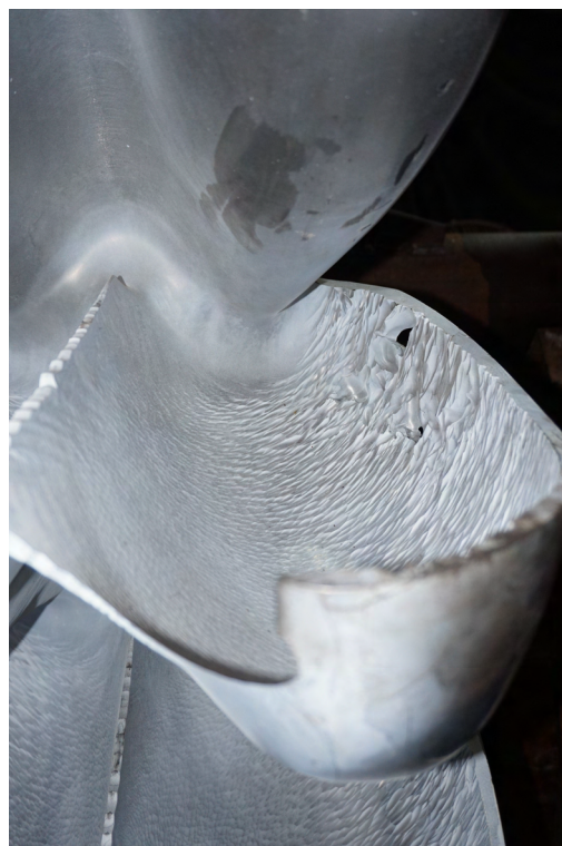
Peltonbøtte med store erosjonsskader. Her er det faktisk gått hull i bøtta, og man kan stikke en finger gjennom