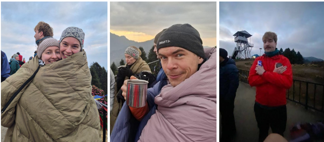
Folk har ulike metoder å holde varmen på.

Vi ble stående og vente og hutre til litt over klokken sju, og fikk noen glimt av toppene rundt oss, men dessverre ikke helt den utsikten vi hadde sett for oss. Tilbake ved frokostbordet lettet heldigvis skydekket, og da fikk vi se store deler av Annapurna-fjellkjeden komme fram bak skyene. Blant toppene vi så var Annapurna II, Annapurna South, Dhaulagiri og Machhapuchhre. Det var nesten litt typisk at den beste utsikten kom først da vi var tilbake til frokost.