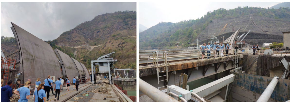
Inntakslukene til oppsamlingsbassenget for sedimenter på Kaligandaki vannkraftverk