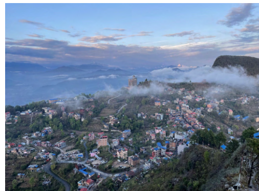
Utsikt fra den nybygde muren i Bandipur, og sikt ned til landsbygda. Kveldskos rundt bålet.