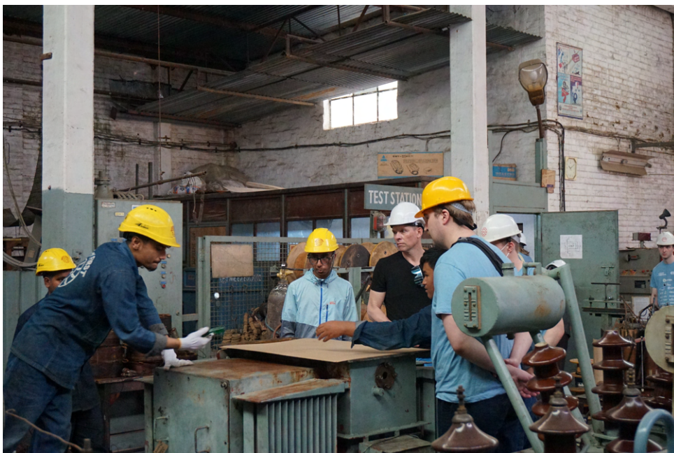
Omvisning på elektroverkstedet, her var det artig nok ett "Høyspenning livsfare-skilt hengende på veggen

Vi kjørte ned mot byen Butwal og startet besøket hos Nepal Hydro & Electric Limited. Dette er et nepalsk selskap som driver med rehabilitering av både mekaniske og elektriske komponenter til vannkraftindustrien. Vanligvis var det bare lov med besøk på fredager, men siden vi var norske studenter fra NTNU, gjorde de et unntak for oss. Vi fikk omvisning på hele anlegget og måtte til og med ha på både hjelm og heldekkende sko. Her var altså HMS prioritert, i motsetning til mange av de andre arbeidsplassene vi hadde sett under oppholdet i Nepal.