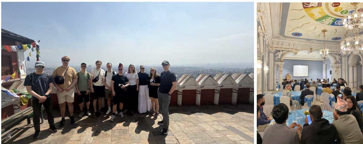
Gruppebilde på toppen av monkey temple og lanseringen til NTNU Global South Initiative.

Alt i alt var dette en innholdsrik og spennende første dag, med mange nye inntrykk både kulturelt, historisk og faglig.