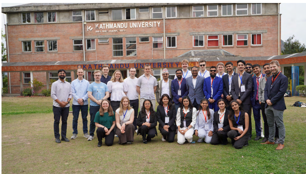
Gruppebilde med masterstudentene fra VKL og studenter og phd-kandidater ved Turbine Testing Lab.