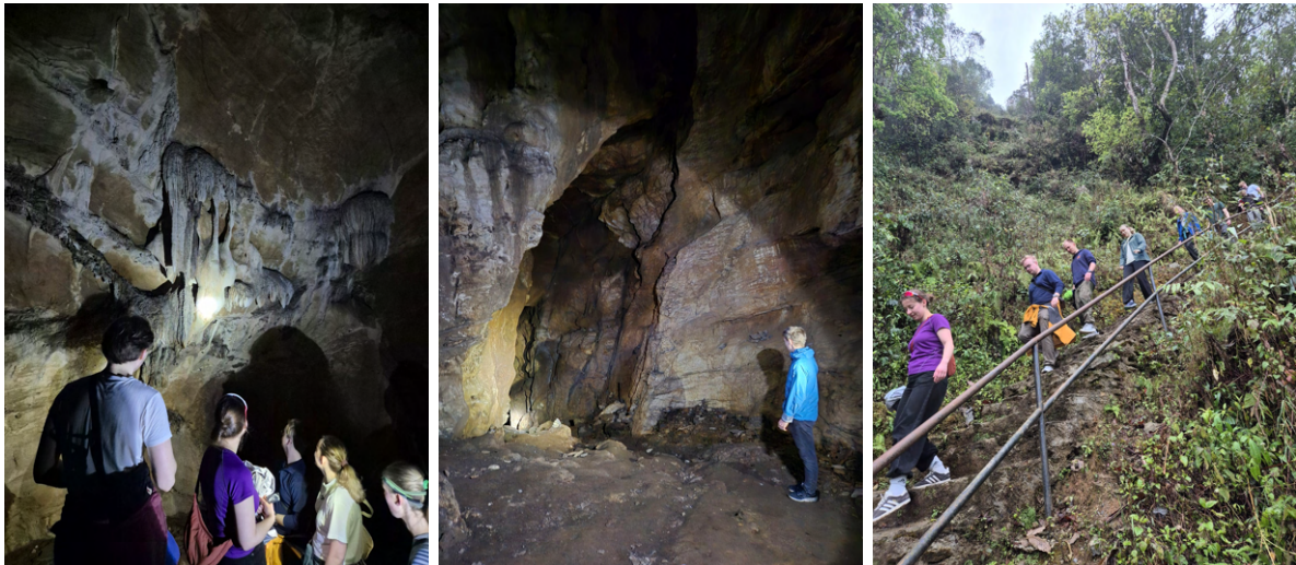
Hulebesøk i Bandipur og omtrent 800 høydemeter med trappetrinn - knærne fikk kjørt seg før vi skulle på fjelltur i Himalaya.

Vel framme i Kathmandu brukte noen kvelden på de siste forberedelsene til konferansepresentasjonene dagen etter, mens andre tok en tur til Thamel. Etter en lang dag med både hulebesøk og busstur ble det uansett en tidlig kveld for de fleste, klare for morgendagens konferanse.