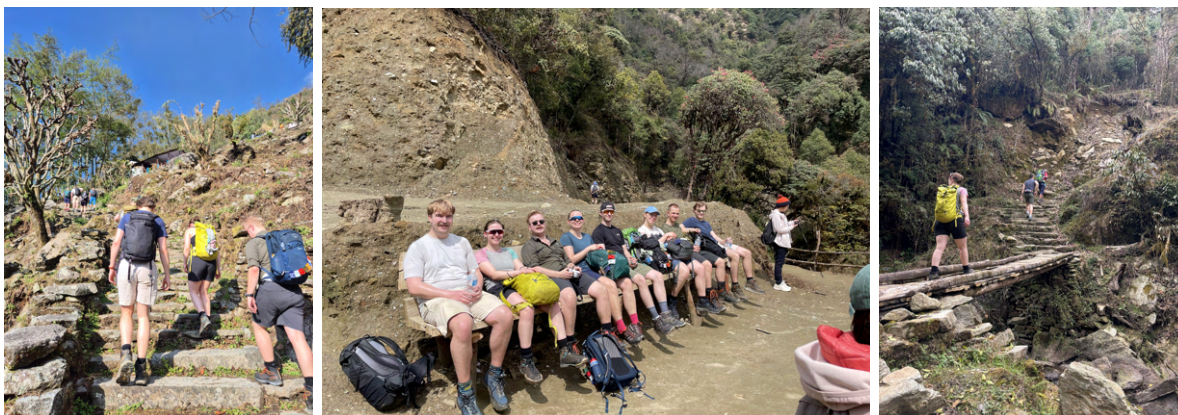
Dagens etappe inkluderte en god del trapper, pauser og mer trapper.

Etter en lang, men effektiv dag med jevn gange og mange høydemeter ankom vi til slutt fjellandsbyen Gorepani rundt klokken 16:00. Her ble det tent opp i fellesstuen, og en sliten gjeng samlet seg for kortspill, tørking av klær og velfortjent avslapning i varmen. Ingefær- og sitronte smakte ekstra godt etter en krevende dag. Middagen ble som vanlig servert klokken 19:00, og etter en forventningsfull tale fra Puru om utsikten som ventet på soloppgangsturen dagen etter, valgte mange å legge seg tidlig.