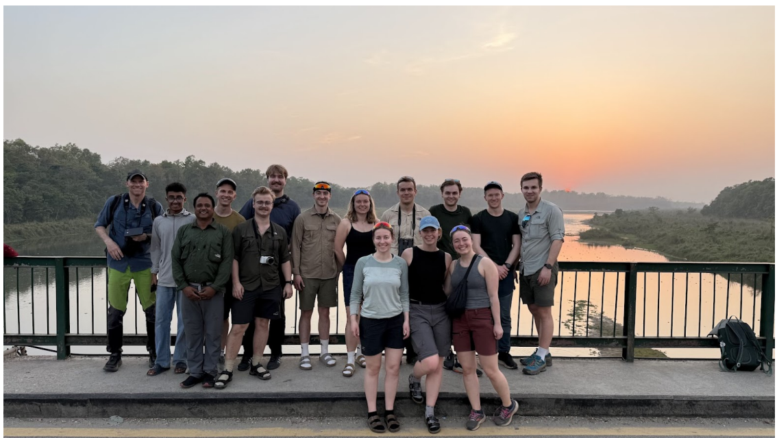
Vi avsluttet dagen med en nydelig solnedgang.