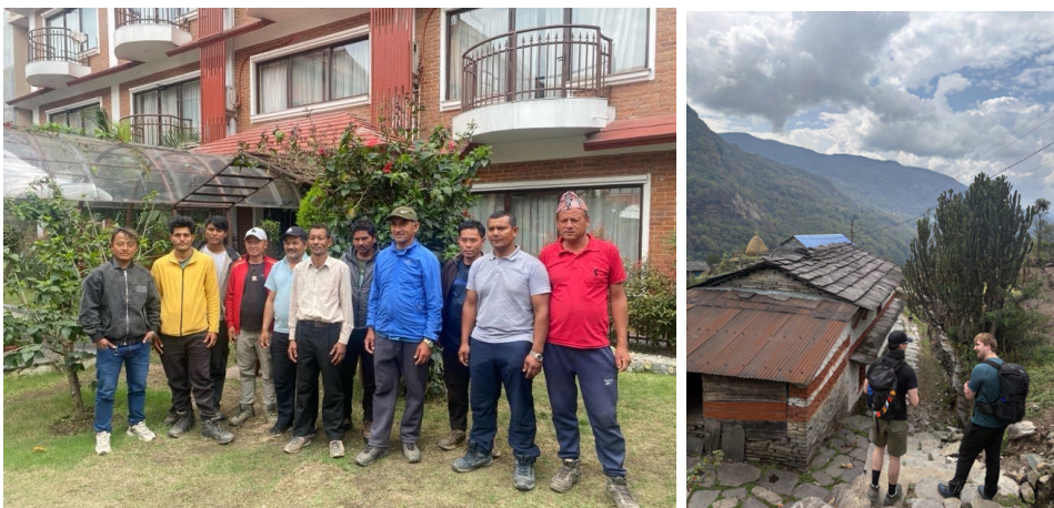
Her et bilde av bærerne vi hadde med oss på turen. Funfact så er ordet Sherpa brukt om et folkeslag i Nepal og er ikke en yrkestittel. Yrkestittelen heter porter!

Bussturen tilbake til Pokhara gikk med til et par runder quiz og litt søvn for store deler av gjengen. På hotellet tok vi farvel med bærerne som hadde vært med oss gjennom hele fjellturen, før alle fikk seg en etterlengtet dusj. Noen tok seg en spasertur i Pokhara, mens andre tok en øl på hotellet. Senere samlet vi oss til felles middag, hvor tikka masala med hvitløksnaan slo spesielt godt an. Vi fikk også prøvd litt forskjellig craft-øl. Etter middag fikk seks av oss prutet ned 60 minutters fotspa til 1000 NPR per person, og slo til på det. Noen tok turen videre til en irsk pub med livemusikk, mens de mest slitne krigerne kom seg tidlig til sengs.