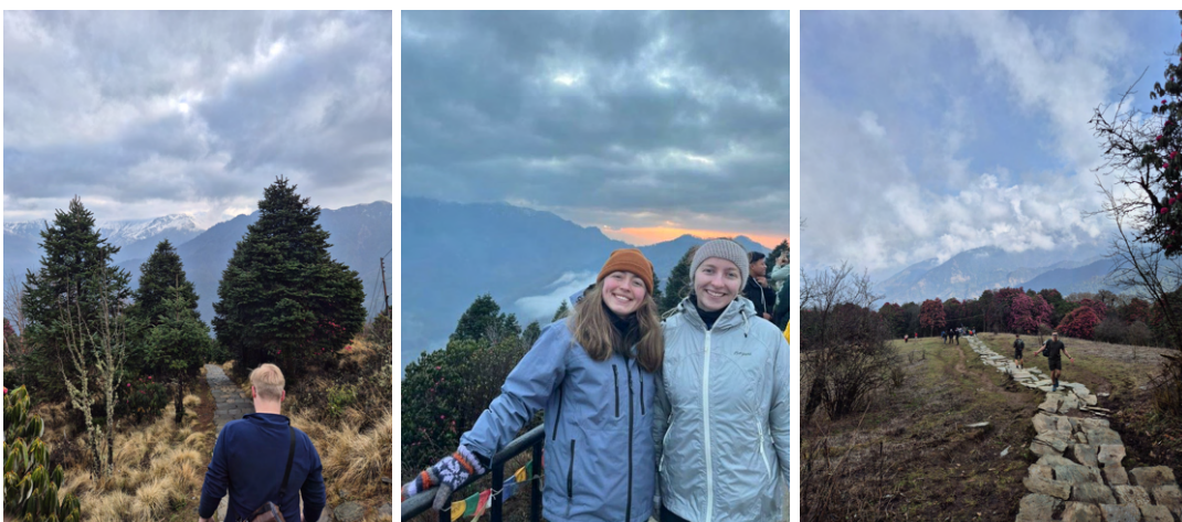
Utsikten er ikke den beste, men naturen rundt oss er likevel fin å se på.