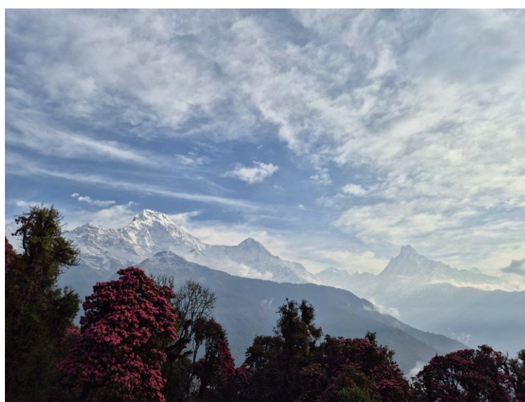
Vi spiller kortspill med Puru og bærerne. Vi fikk endelig sett de etterlengtede fjelltoppene.