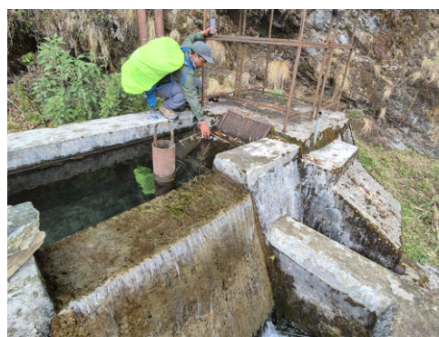
Oss, på toppen av Poon Hill og et lite kraftverk vi snublet over på stien!