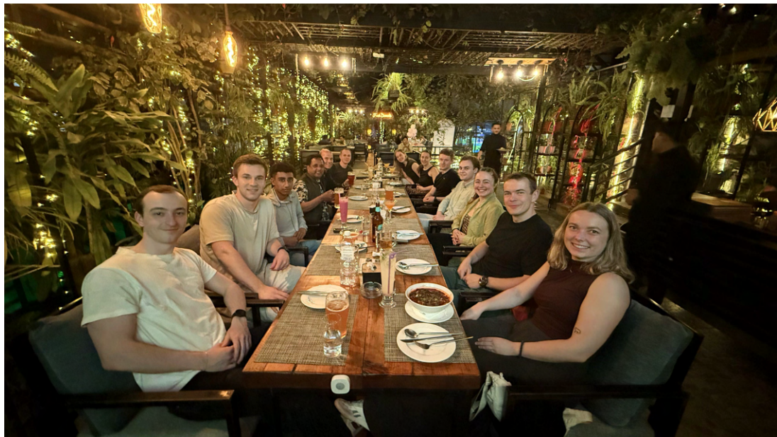
Dagens aktiviteter var både luftig og hyggelig.