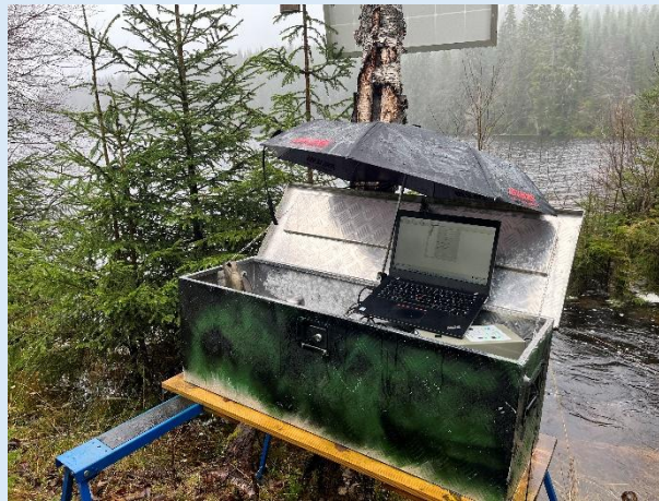
Figur 2: Forsøk på oppdatering av programvare på PIT-antenne ved uløpet av Botnetjernsbekken