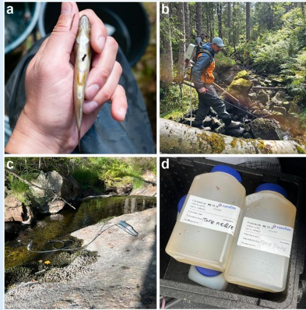
Figur 5: Bilder fra feltarbeid. Bildene fra a til d viser henholdsvis tagging av 1+ ørret med PIT-tag, studenten under elektrofiske, måling av vannføring med saltfortynningsmetoden på lav vannføring om sommeren, og vannprøver som skal gis til Eurofins for analyse.