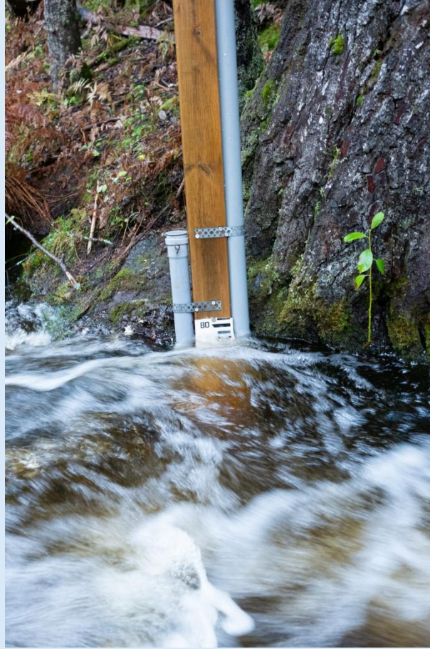
Figur 3: Vannstand under høstflom i Stårsjøbekken. PVC-rørene inneholder pH-logger (t.v.) og trykklogger (t.h.).