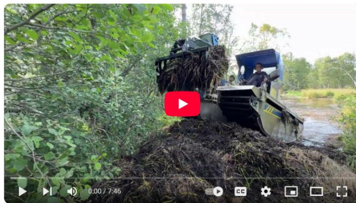
Nå har livet kommet tilbake i den gamle gjengrodde kanalen på Rindalsskoen