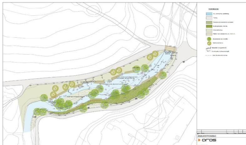
Illustrasjon av tiltak: Aros Arkitekter