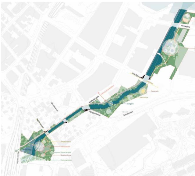
Illustrasjon fra Mulighetsstudie, Cowi, 2020