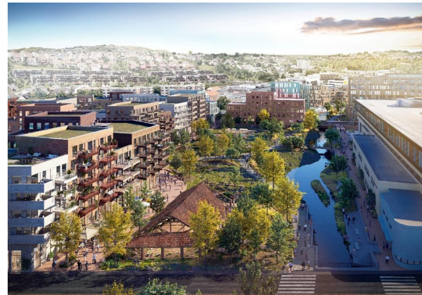
Illustrasjon av Elveparken: Mad Arkitekter, 2022