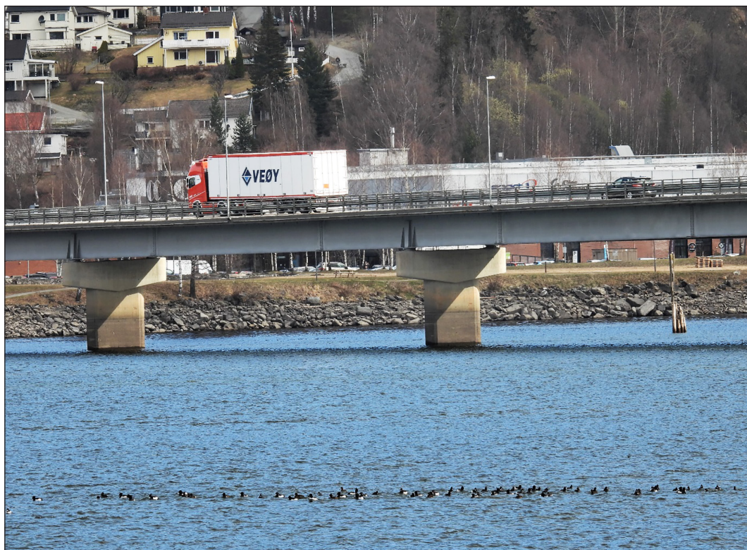
Bilde 1. Dagens E6 går tvers gjennom vannfuglenes kjerneområde under vårtrekket. Her er en flokk på over 100 toppender på næringssøk ovenfor brua.

Det samme gjelder de krappe og svært flomutsatte akselerasjonsfeltene mot E6 inn og ut fra Mesnadalsarmen/Strandtorget. Med høstens «Hans» friskt i minne (med en måneds avstenging) kreves betydelig nivåheving og en langt større kurvatur, dvs. store arealbeslag utover i fuglenes sentrale rasteområder.