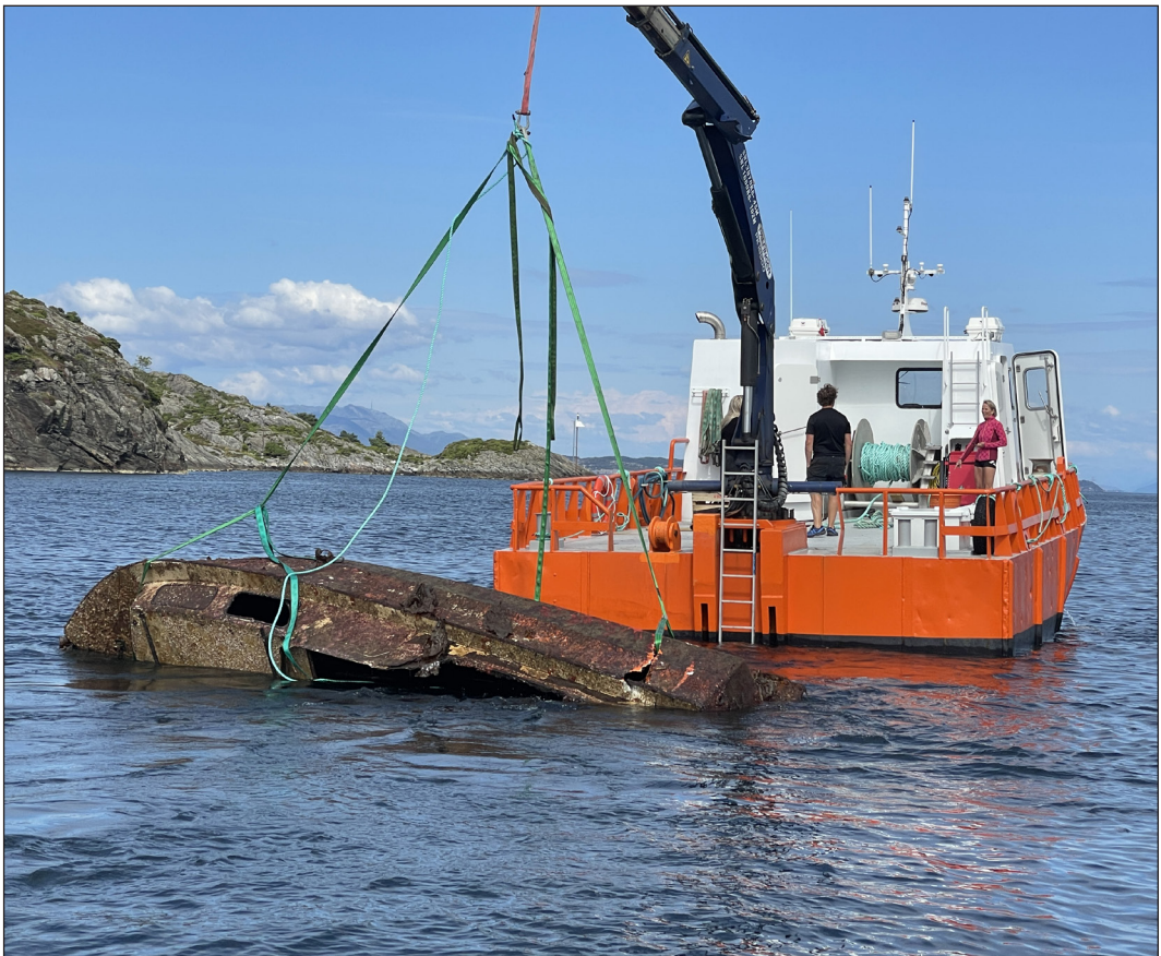
Figur 2. Båtvrak heves fra vannet.

– Vi tar gjerne imot tips om steder der det befinner seg mye avfall i havet, enten det er på havbunnen eller på strendene. Det vil hjelpe oss stort i «jakten» på mer og miljøskadelig avfall, avslutter Åge Wee, styreleder i miljøvernorganisasjonen Clean Ocean.