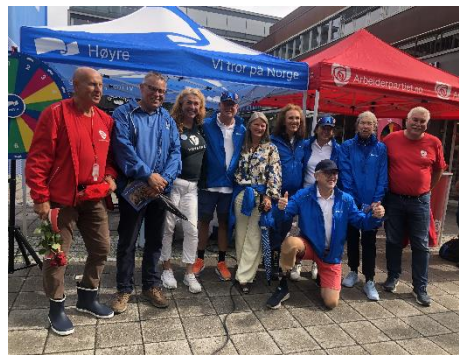
4 av flere partier

17. Grønnstruktur 17.1 Grønnstruktur (pbl. §§ 11-7, nr. 3, 11-9 nr. 5 og 6 og arealplankartet) skal vegetasjon bevares på en måte som sikrer ferdsel til fots med bruksbredde på inntil 1,5 meter), naturlekeletter, nødvendig skjøtsel av vegetasjon. Terrengendringer er illebegynnet. 17.2 Friområder (pbl. §§ 11-7, nr. 3 og 11-9, nr. 6) Innenfor friområder tillates tiltak som styrker allmennhetens bruk og friluftsopplevelser.