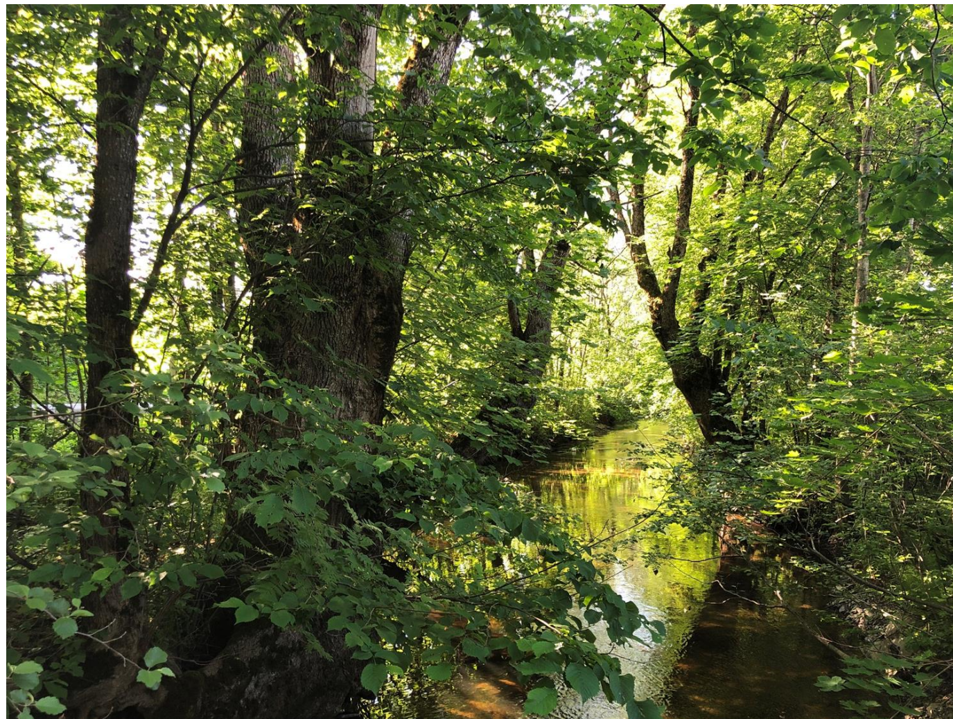
Askerelva i Asker sentrum med en trerekke mellom fylkesvei og gangvei