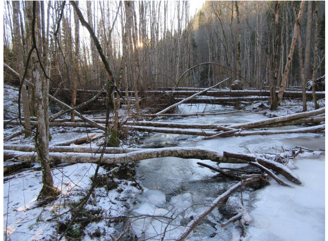
Askerelva i landskapsvernområdet mellom Semsvann og sentrum