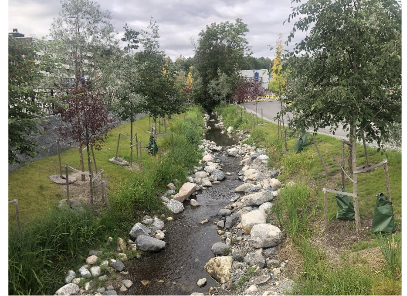
Drengrubekken åpnet og flyttet til Føyka i nytt møte med Askerelva (Føyka er Asker Skiklubbs idrettsområde i Asker sentrum) Design: Håkon Gregersen, Norconsult