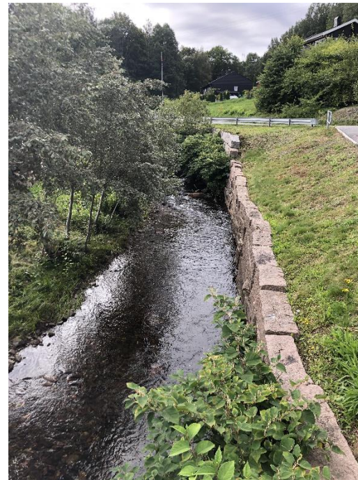
Sætreelva i Sætre sentrum Parkslirekne!