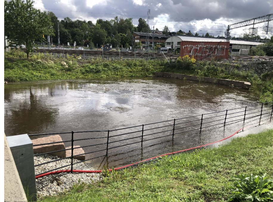
Askerelva 27.08 og 28.08