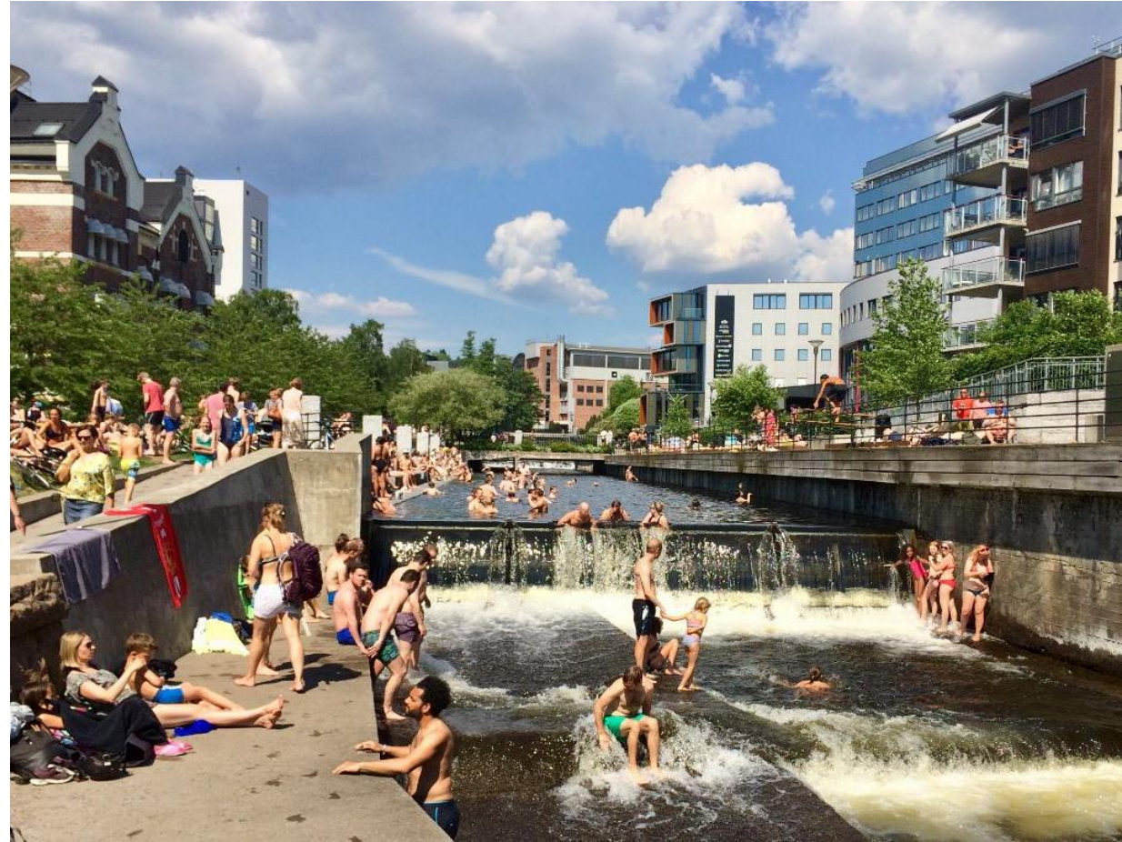
Akerselva i Nydalen