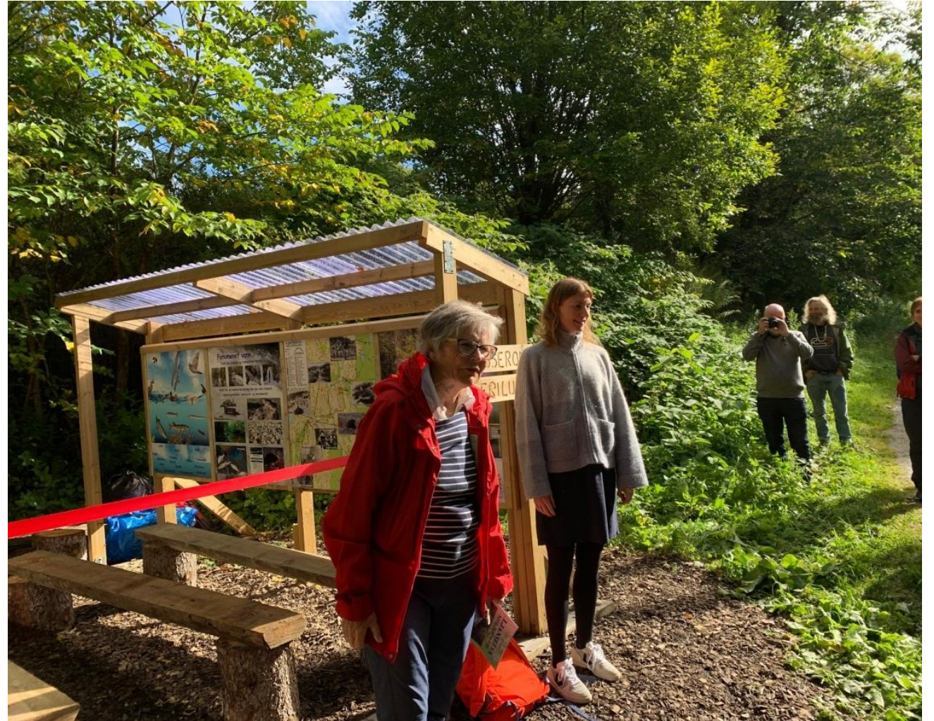
Klasserom i friluft ved Ljanselva