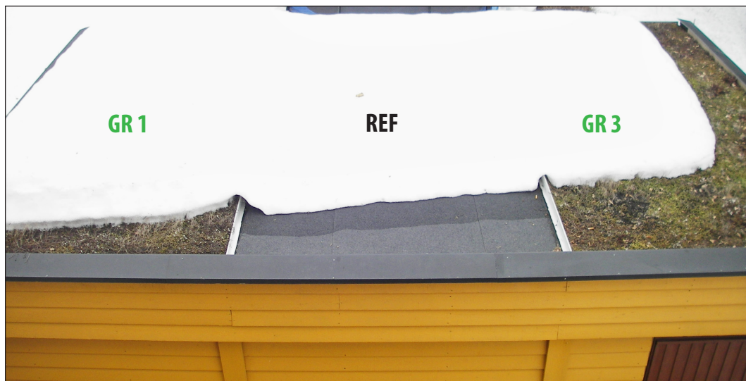
Figur 1. Forsøksfeltet er en garasje med 3 felt på 8 m 2 hver (Foto: 3. mars 2011).