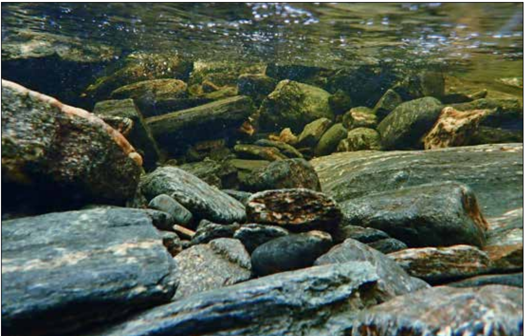
Utsikta frå ein vasskikkert i Stordalselva i Agdenes. Her er det lite påvekstalgar, men truleg mange botndyr som gøymer seg under steinane.

http://www.miljodirektoratet.no/Documents/publikasjoner/M1019/M1019.pdf