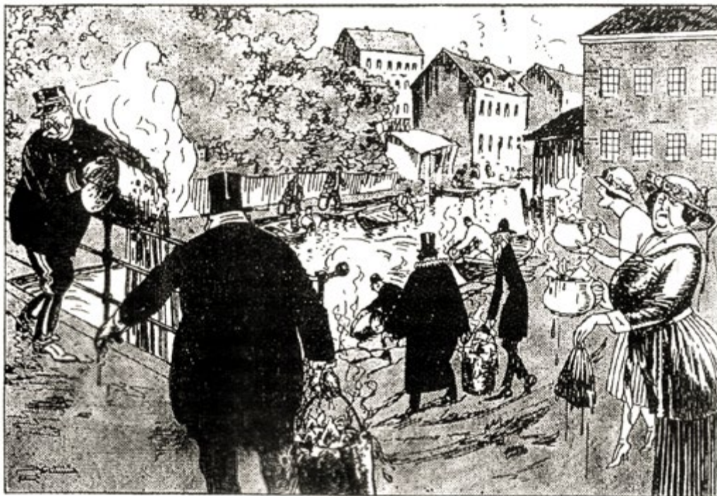
Idyl fra Akerselven under storstreiken.