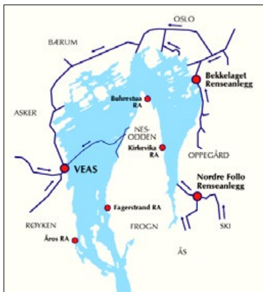
Figur 1. Avløpsrenseanlegg og tunneler rundt indre Oslofjord.

De aller fleste vanninteresserte kjenner vel rimelig godt til hva som har skjedd for å rydde opp i forurensningen i Oslofjorden de siste 50 årene; de store investeringene på avløpssiden i rensenanlegg, avløpstunneler, avskjærende ledninger m.m. Figur 1 viser hovedstrukturen i avløpssystemet rundt indre Oslofjord, en velkjent figur