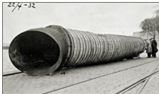
Figur 6. Utslippsledningen lagt i 1931 fra Vippetangen ble revet opp av et skipsanker i 1932.

Forskere på Universitetet i Oslo (UiO) undersøkte fjorden mer nøye, og tidlig på 50-tallet konstaterte de oksygenfrie områder i store deler av