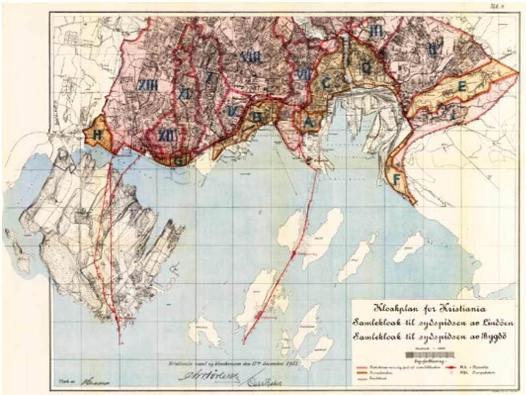
Figur 5. Kloakkplan for Kristiania 1913.

I de neste årene ble seks tilsvarende renseanlegg bygget. På Skarpsno ble det bygget en stor septiktank. En revidert avløpsplan ble vedtatt i