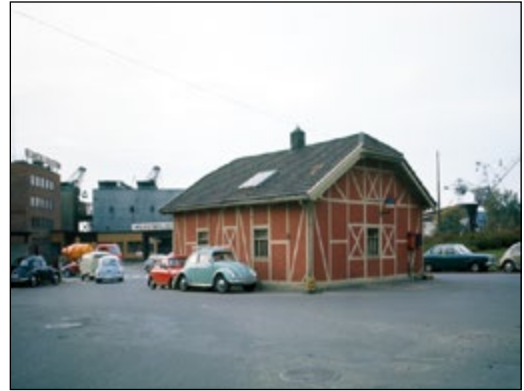
Figur 4. Kristianas første renseanlegg på Filipstad fra 1910: «Rhienische separatorskive». Bygningen sto helt til 1987.

satt i drift på Filipstad i 1910 – en såkalt «Rhienische separatorskive» av tysk fabrikat, figur 4.