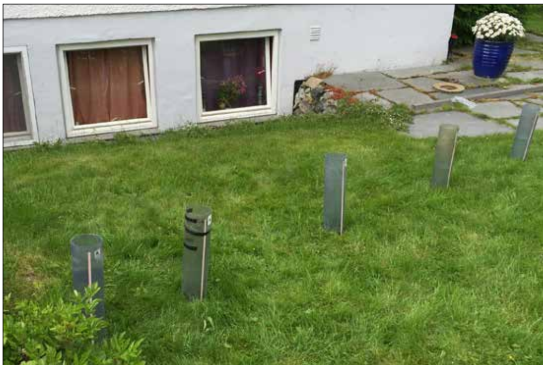
Figur 1. Foto av oppstilling av MPD-rør i L34. Fem MPD-rør fordeles i plenen der takvannet er forventet å renne fra takutkastet. Rørene er merket fra a-e, der a er nærmest takutkastet. (Foto: Bent C. Braskerud).

gjennomsnittsverdien ble brukt i de videre beregningene. For å vise den store variasjonen i mettet hydraulisk konduktivitet i hvert felt, kan også den minste og den største målte verdien for K_{\text{sat}} ses i tabell 1. Verdiene som er brukt for hvert felt i beregningene kan ses i tabell 1.