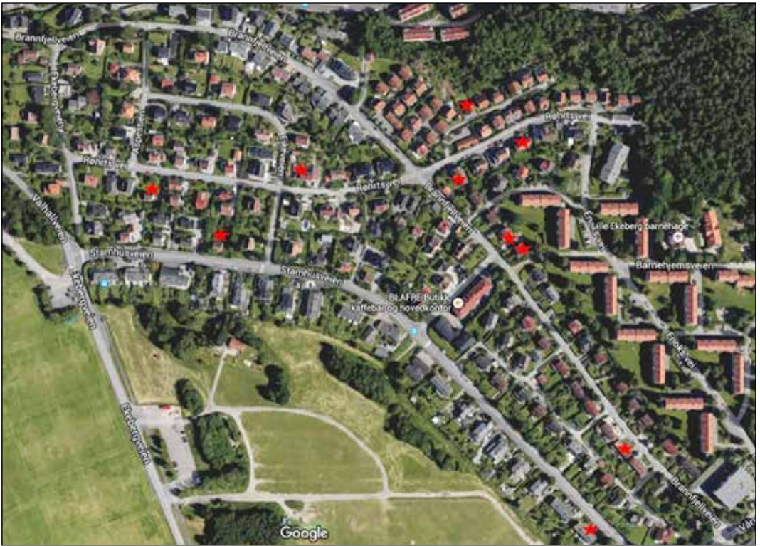
Figur 2. Kartet viser de forskjellige feltene som ble undersøkt på Ekeberg i Oslo (maps.google.no).