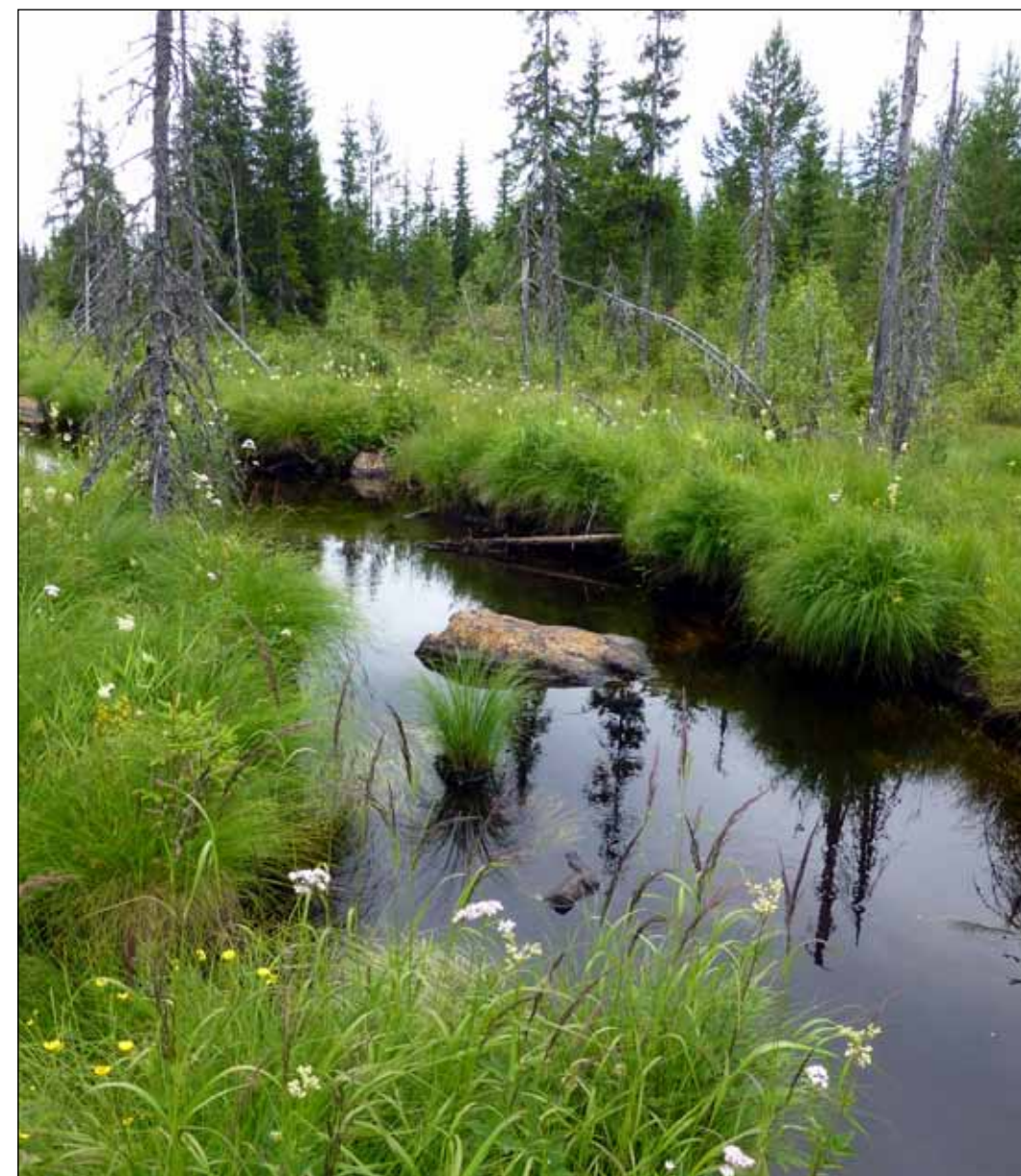
Bilde innsendt til Norsk vannforenings fotokonkurranse 2014.