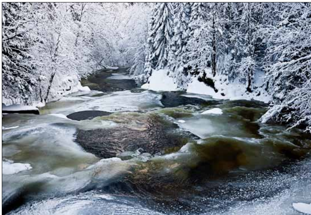
Bilde innsendt til Norsk vannforenings fotokonkurranse 2014. Åroselva vinter 2007.