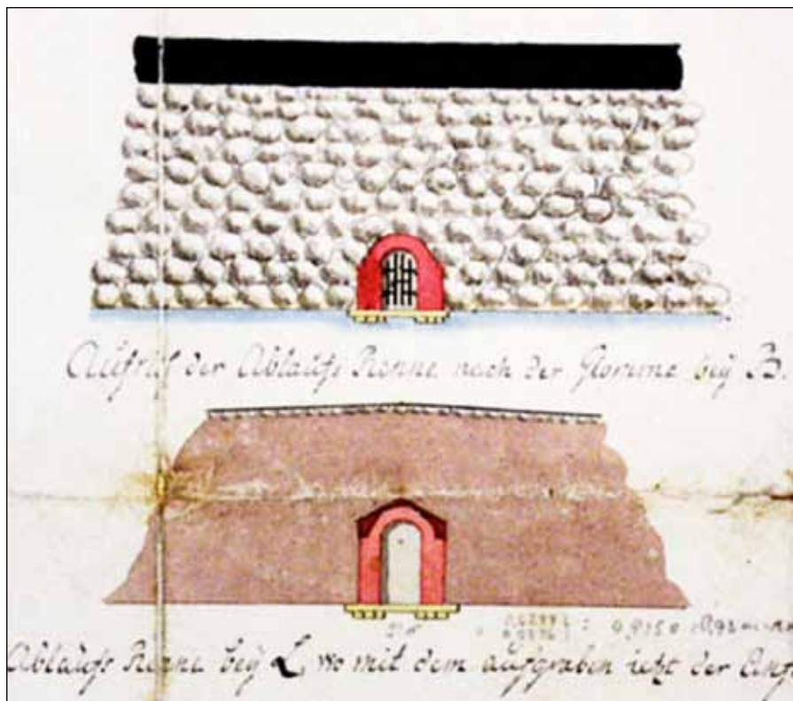
Figur 6. Utløpet for avløpsrøret ut i Glomma

VANNdringen ender på museet hvor vi kan ta røret og den tømrede vannkummen fra 1655 nærmere i øyesyn. Bybrannene har også preget Gamlebyens historie. Utstillingene og ”fortellingene” på museet gir noen interessante perspektiver på hvordan slokkevann ble benyttet før. Den siste totale bybrannen rammet byen i 1764 . Denne gangen ble alle byens privathus ødelagt, sammen med alle sjøboder og lagerbygninger som befant seg mellom vollene og elven.