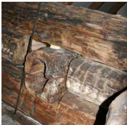
Figur 7. Vannrøret fra 1655

VANNdringen ender på museet hvor vi kan ta røret og den tømrede vannkummen fra 1655 nærmere i øyesyn. Bybrannene har også preget Gamlebyens historie. Utstillingene og ”fortellingene” på museet gir noen interessante perspektiver på hvordan slokkevann ble benyttet før. Den siste totale bybrannen rammet byen i 1764 . Denne gangen ble alle byens privathus ødelagt, sammen med alle sjøboder og lagerbygninger som befant seg mellom vollene og elven.