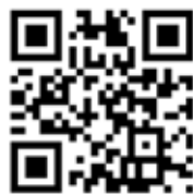
Figur 2. QR-kode

Tredje stopp på vår VANNdring er Vanntrøa . Vår vanntrø er og blir et symbol på det livsviktige vannet, men er også