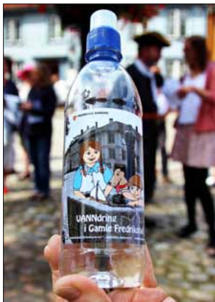
Figur 3. Utdelte flasker

Femte stopp er Fergeportgaten/Kirkegaten . Her avdekket en utgraving i 2002 en gammel tømret kum og et stort vann-