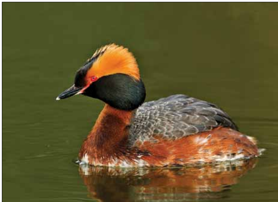
Bilde 2. Horndykker (Foto: Jan Erik Heggelund).

Slik arbeidet er organisert ser en et samarbeidet mellom Fylkesmannen og en frivillig miljøgruppe utløser stor virksomhet, gir resultater og viktig miljøinformasjon blir samlet under Fylkesmannens forvaltning. På alle måter en vinn-vinn situasjon for begge parter og ikke minst for miljøet. Det er ingen konflikter mellom Våtmarksgruppa, grunneiere eller offentlig forvaltning. Dette er en samarbeidsmodell som har fungert svært godt, noe som er en svært medvirkende