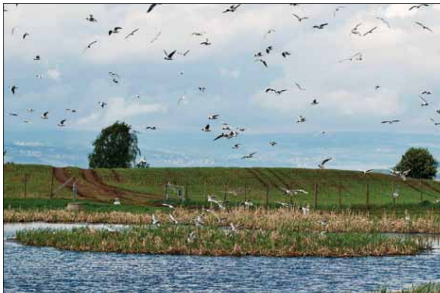
Bilde 1. Dam (Foto: Jan Erik Heggelund).

Det ble også utviklet en formell samarbeidsavtale mellom Fylkesmannen og Våtmarksgruppa. Denne avtalen fornyes hvert år, og avtalen går ut på at grappa skal følge opp aktuelle våtmarks- og restaureringsprosjekter i Hedmark. Våtmarksgruppa følger imidlertid også opp