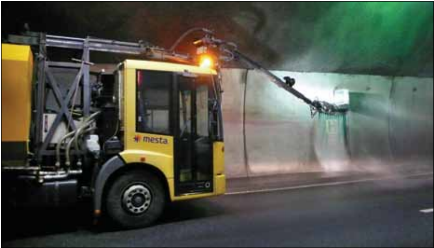
Figur 1. Rengjøring av Nøstvetunnelen (E6, Akershus) i 2011.