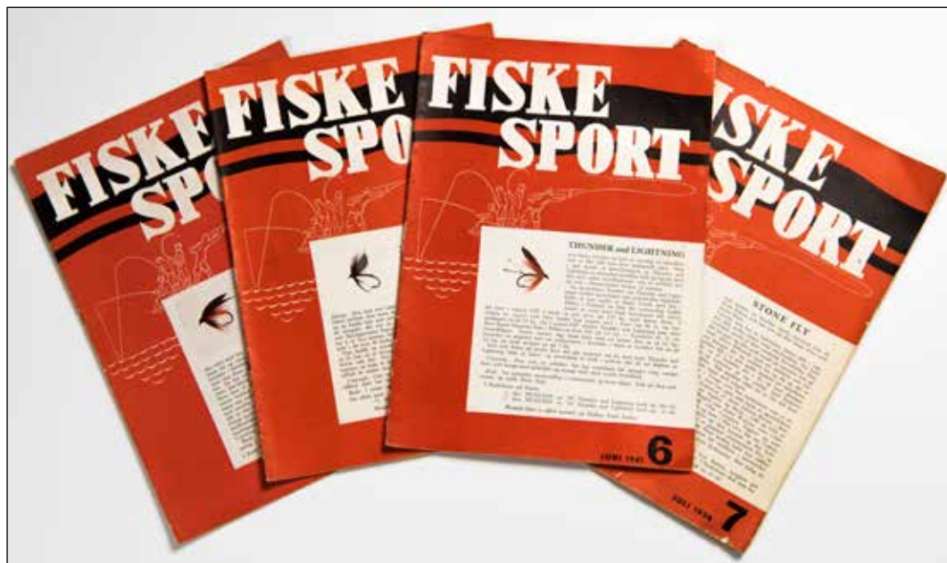
Tidsskriftet Fiskesport : Foto: Audbjørn Rønning/Maihaugen

Begrepet demokratisering åpner opp for et klasseperspektiv. I artikkelen tas det derfor høyde for å drøfte og tolke kildene i lys av økonomiske, sosiale og kulturelle forutsetninger. Vi vil løfte frem noen analytiske poenger gjennom å diskutere det empiriske grunnlaget for artikkelen opp mot Pierre Bourdieus teori i boken Distinksjonen (Bourdieu [1979]1995).