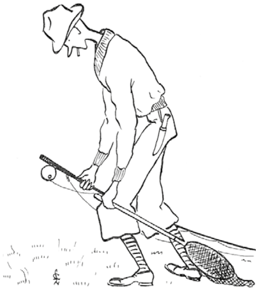
«Fluefiskeren» (som kasteslukfiskeren ser ham).

Vi får gjennom artikkelforfatterne et innblikk i de sportslige idealene som eksisterte hos de etablerte sportsfiskerne. De var fluefiskere, og fluefiskets vanskelighetsgrad opphøyde aktiviteten til kunst og god sport. Fluekastet fordret teknikk, rytme og trening, og fluesnørets elegante bevegelse gjennom lufta og den vakre fluekreasjonens lette og presise nedslag på vannet var estetiske elementer fluefiskerne stadig fremmet i sin karakteristikk av fluefiske. Dette i motsetning til fluefiskernes karakteristikk av mange av de nye fiskerne og kasteslukutstyret. Utstyret bestod av stive og masseproduserte stenger med kastesluksneller som gjorde det enkelt å kaste, og sluken var en serieprodusert metallgjenstand som plasket når den landet, og som fisket effektivt uten noen form for trening og kunnskap. Slukfisket manglet derfor fluefiskets iboende estetikk og krav til kunnskap og ferdigheter. Det ble for «lettkjøpt», «simpelt» og enkelt. Det