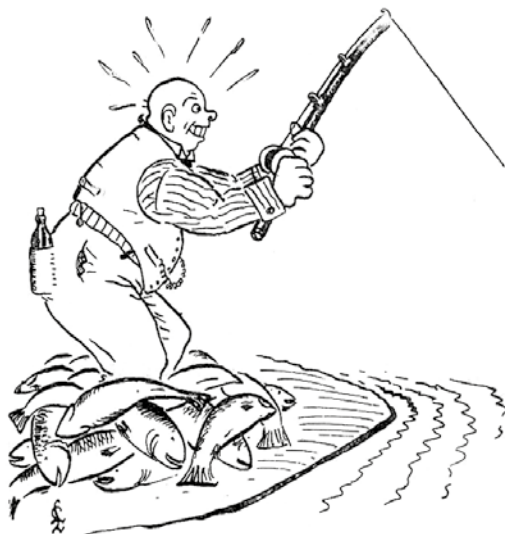
«Kasteslukfiskeren» (som fluefiskeren ser ham).

Faksimile fra Fiskesport 1939 «fluefiskeren og slukfiskeren».